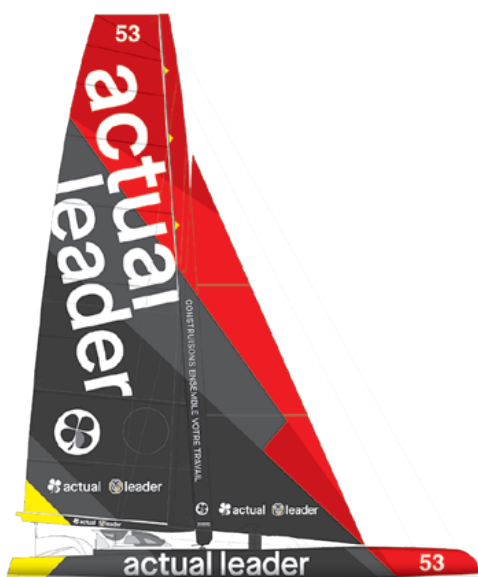
Actual Leader Ultim

De nouveaux foils pour améliorer les performances du bateau, sans toucher au bateau !