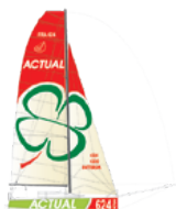
Mini 6.50 Actual