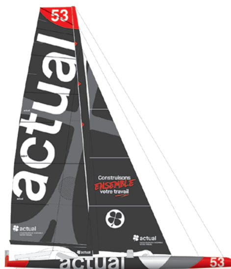
Actual Ultim 3