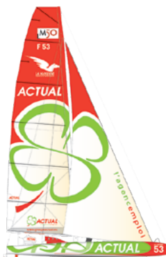
Multi 50 Actual